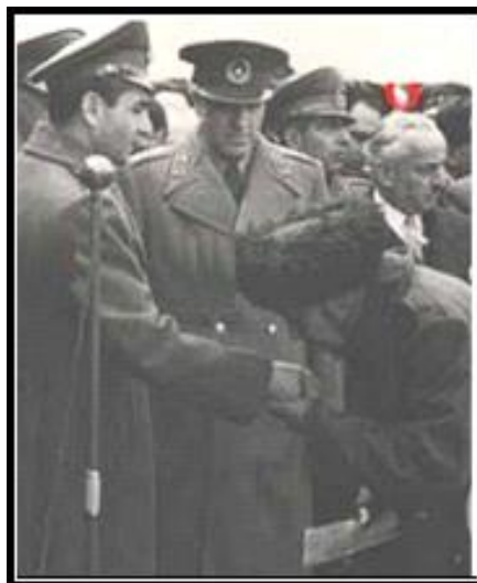
شاه و زاهدی و تورکمنی که بهنگام دریافت سند زمین اش دستبوسی می کند!