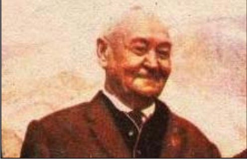
بردى كريبابا اۇغلى (۱۸۹۴-۱۹۷۴)