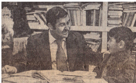
Şahyr agtygy bilen