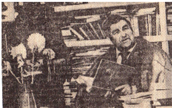
Şahyr öýündäki iş kabinetinde 1971